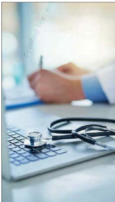
Sugestão dos médicos visa libertar profissionais para o Covid-19