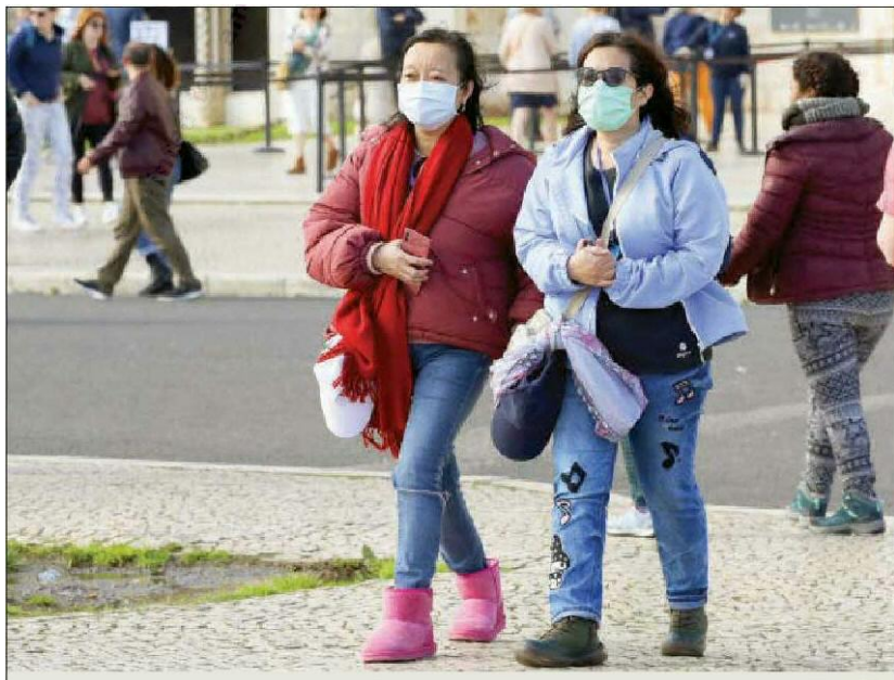
Vírus com origem na China já fez mais de 100 mil infetados em todo o Mundo